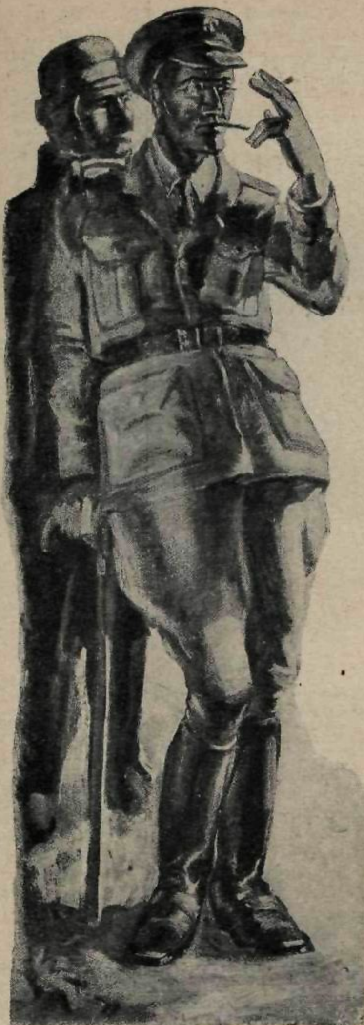
Аналичанин, не вынимая папиросы изо рта, небрежно приложил два пальца левой руки к козырьку...

Рассказ Н. ШПАНОВ, иллюстрации Н. СОКОЛОВА.